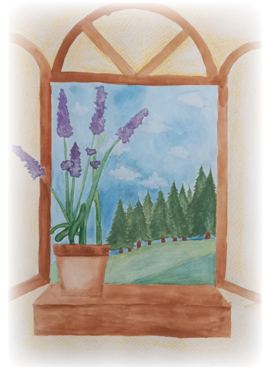
Simón Robledo Espinosa