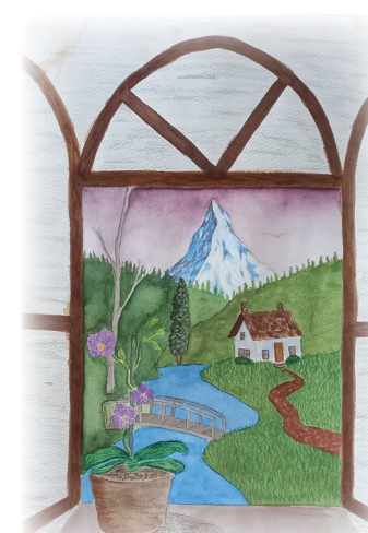
Cristóbal Godoy Holguín