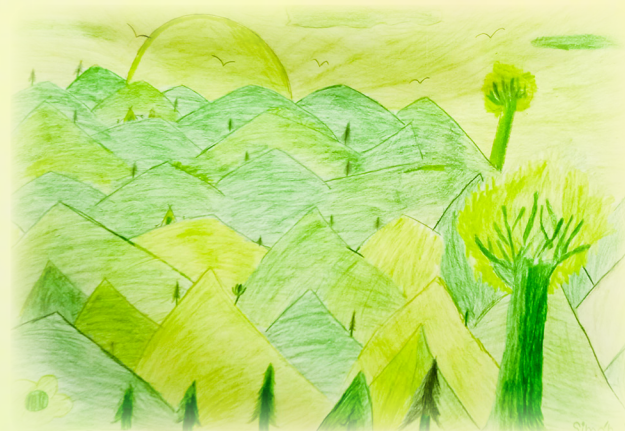
Símón Velásquez Vélez Grado Sexto