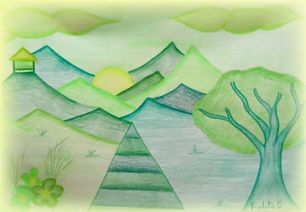
Violeta Carvajal Bustamante Grado Sexto

El verano había llegado con pasos cálidos y dorados. Los días eran largos, el cielo era de un azul brillante y el sol brillaba con mucha, mucha fuerza.