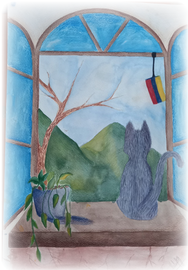
Valentina Escobar Jaramillo