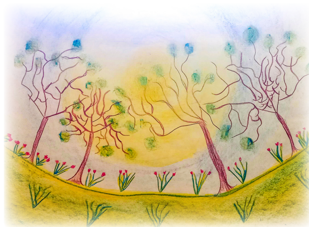
Sofía Múnera Guzmán Grado Tercero

En el bosque la encontrarás, enrollada en un roble sin igual. Parece la combinación perfecta: el árbol fino de un gran color y la rosa roja que le da esplendor; una unión que tiene mucho valor por su gran aprecio y respeto ante el sol.